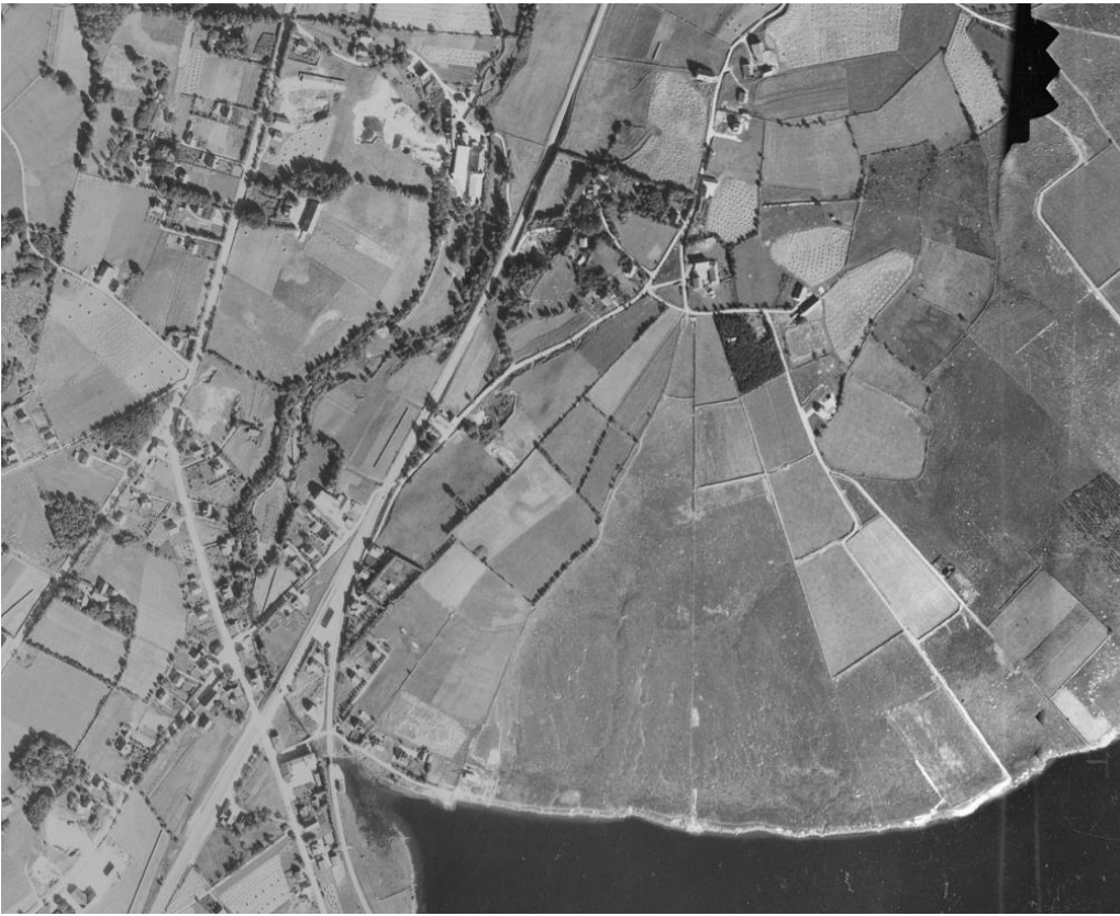
DET SENTRALE OMRÅDET MED LUNDE FOTOGRAFERT 1937. LUNDEBRUKET BAKKANE LIGGER PÅ BRINKEN AV MORENEN. HER ER NÅ BARNEHAGE.