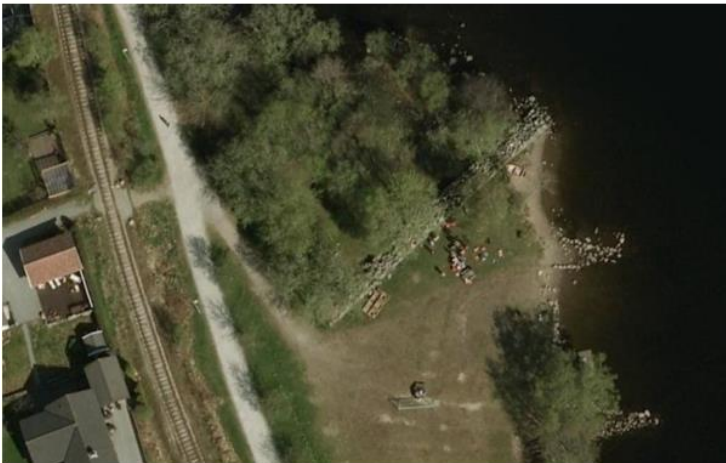
STEINGARD TIL PANSERSPERRINGEN PÅ BADESTRAND VED STOKKALANDSVATNET.

For å beskytte Festung Stavanger mot angrep fra sør ble det bygd en pansersperring ved den sørlige grensen av festningsverket. Pansersperringen, som tyskerne startet å bygge i 1942, er et eksempel på den store innsatsen tyskerne la ned i å sikre seg kontroll over Stavangerhalvøya og det nye festningsverket som ble bygget her. Mens Festung Stavanger var avgrenset av sjøen i andre retninger, lå grensen mot sør på flatt jordbruksland. Her var det fare for både luftangrep og angrep med bakkestyrker. Tyskerne bygget flere støttepunkt langs denne forsvarslinjen mot sør, helt fra Høyland til Vigdel. I tillegg til dette skulle hele strekningen bli beskyttet av en pansersperring, som skulle være en hindring for stridsvogner på vei mot Stavangerhalvøya. Pansersperringen gikk helt fra Stokkalandsvatnet på Ganddal til Vigdel. I tillegg til dette ble det bygget en lignende pansersperring på Høyland, ved veien mot Ålgård. Sammen med støttepunktene, skulle pansermuren sikre et bedre forsvar mot sør, uten at soldater måtte være tilstede langs hele strekningen.