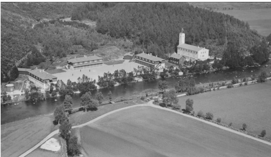
1954 WIDERØES FLYVESELSKAP AS. NASJONALBIBLIOTEKETS BILDEARKIV