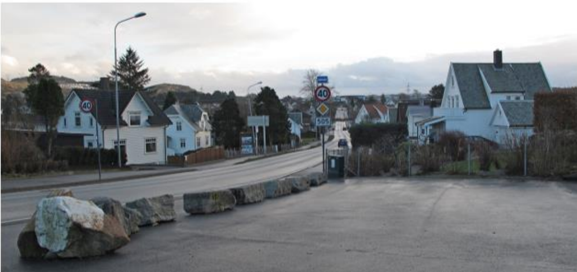
KVERNELANDSVEIEN MOT KROSSEN.

Mye av den første tettbebyggelsen kom langs gamle veier som tok av fra Jærveien og krysset hverandre her. Veier eldre enn jernbanen. Kvernelandsveien sørøstover, Lundegeilen, Elveosen med bru over Storåna og retning morenehøyden. Utbyggingen synes å ha begynt rundt århundreskifte. Hus med blandede funksjoner nærmest krysset, kalt Krossen og jernbanestasjonen. Forretninger, kafeer, industri og hus for fellesfunksjoner. I dag skiller store Ebeneser se ut, som representant for bedehuskulturen på Ganddalen. Lenger fra Krossen små enkle trevillaer i sveitserstil og ulike kombinasjoner av jugendstil, som det tross vekslende autentisitet er lett å knytte til byggeperiode og som knytter hufvene i tettstedet historisk sammen. Opprinnelig var boligbebyggelsen romslig med store hager, som nå er fortettet.