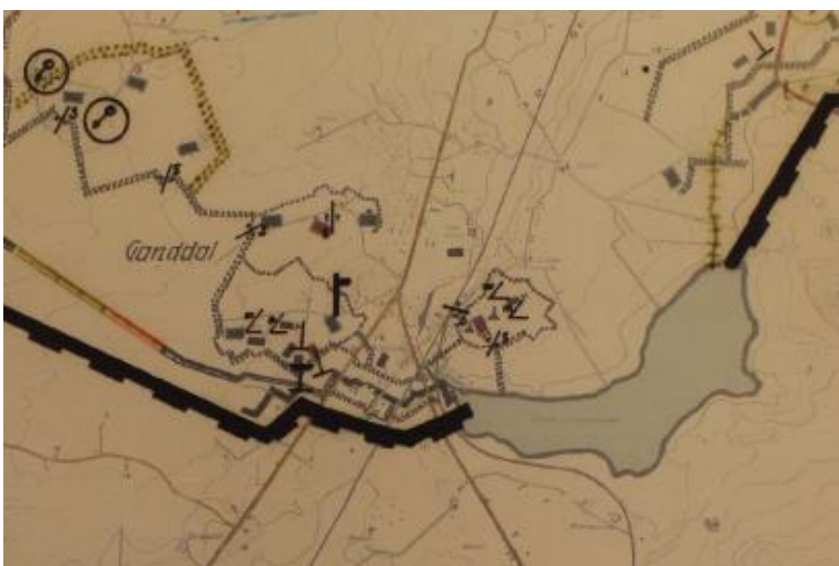
FESTUNG STAVNGER 1945 – DETALJUTSNITT - KARTET VISER FESTNINGER, BUNKERSER OG ANDRE MILITÆRE INNRETNINGER