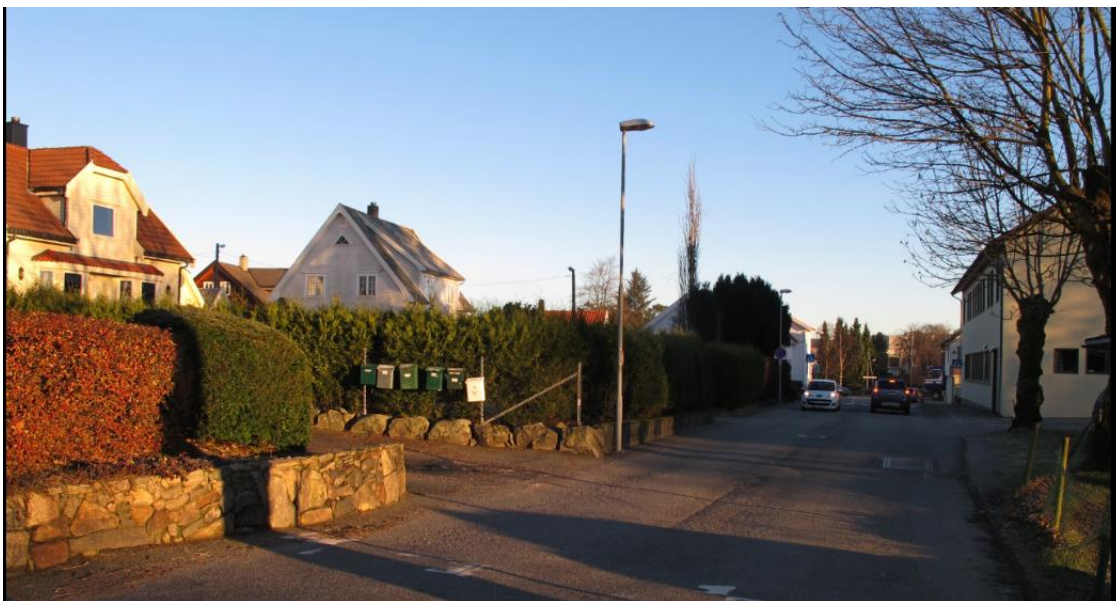
LUNDEGEILEN INN MOT KROSSEN

I krysningen mellom jernbanen og de gamle veiene oppsto tettstedet Krossen, Gandalens sentrum, med bebyggelse fra tidlig 1900-tall og utover. Karakterisert av villabebyggelse og hus for ulike næringsfunksjon er og servicefunksjoner, ikke minst forsamlingshus knyttet til det rike bedehuslivet Ganddal er kjent for. En kultur som hadde sin historiske base i miljøet på Åse Dreieri.