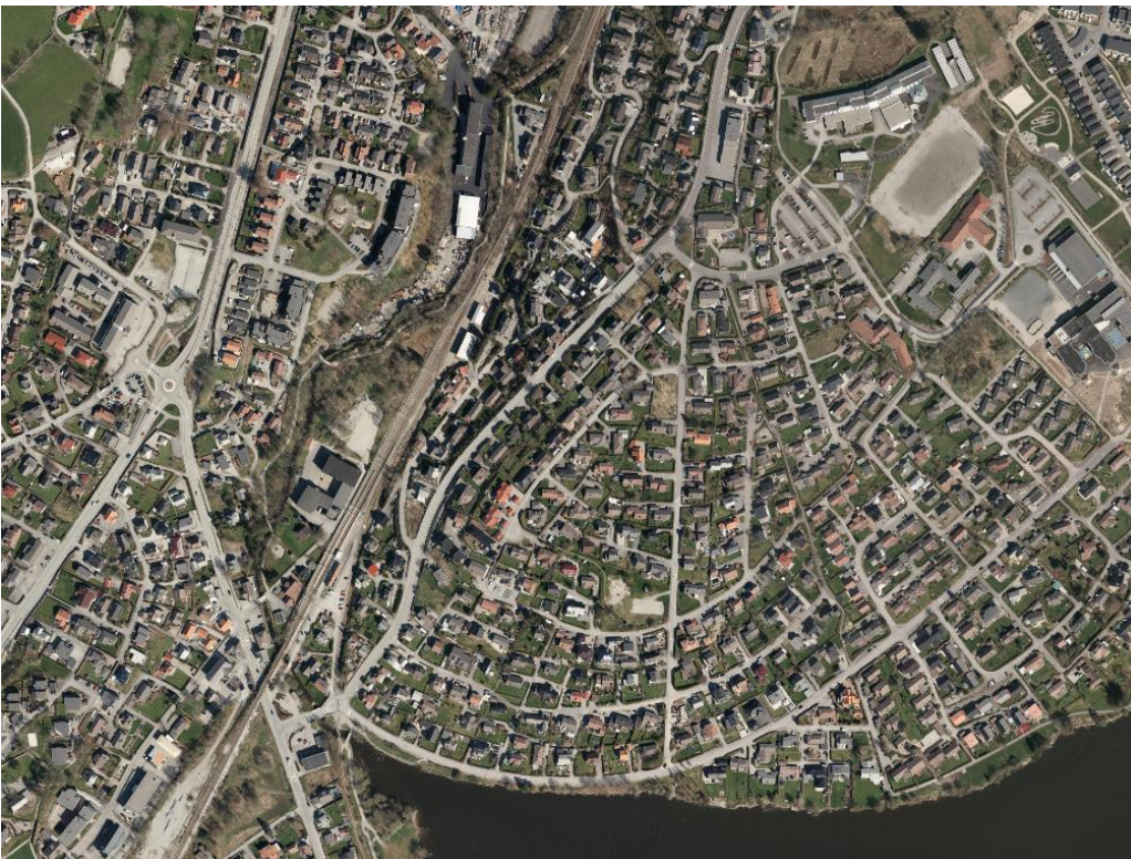
FLYFOTO OVER GANDDAL SENTRUM 2015. GATEMØNSTERET BYGGER PÅ GAMLE EIEDOMSTEIGER.