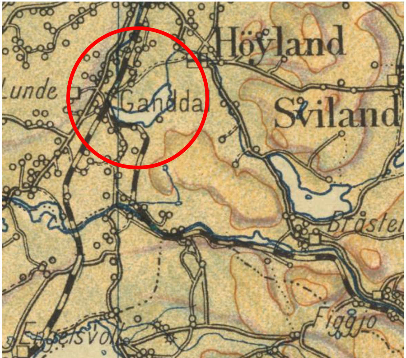
GANDDAL SENTRUM - SKOLEKART 1937