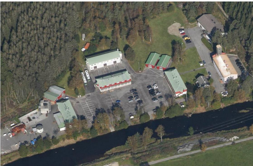
VAGLELEIREN FOTOGRAFERT 2014

I 1937 ble nye regler for sivilt luftvern i Norge vedtatt. Den spanske borgerkrigen var utløsende faktor. Landet ble inndelt i luftvernkretser. Hver krets fikk en sjef for tjenestegrenene: brann, sanitet, varsling og samband. Tallet på kretser økte stadig. Jæren fjernhjelpsleir, Valgeleiren, ble etablert omtrent samtidig med 13 øvrige fjernhjelpsleirer rundt i Norge. De første grunnarbeidene startet i 1951 og i 1953 ble leiren tatt i bruk. Vagleleiren er oppført etter typetegninger, etter samme mal som flere andre leirer i landet. Leirplanen, uteområde og bygningsmassen har høy grad av opprinnelighet. Leiren har stor regional kulturhistorisk verdi som et svært godt bevart kulturmiljø fra den kalde krigen. Riksantikvaren har gitt et tilsvarende anlegg i Møre- og Romsdal fredningsstatus (Forsvarets landsvernplan).