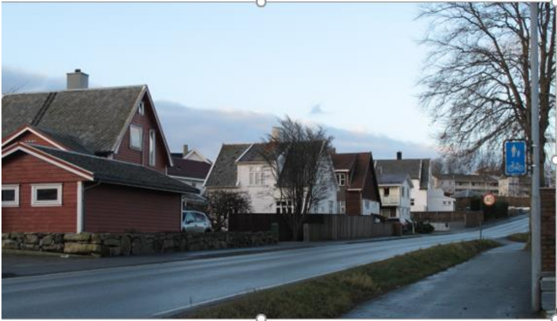
BOLIGBEBYGGELSE PÅ VESTSIDA AV KVERNELANDSVEIEN ER FORTETTET I HAGENE, MEN DEN ELDRE BEBYGGELSEN GIR FORTSATT TIDKARAKTER TIL BYBILDET.