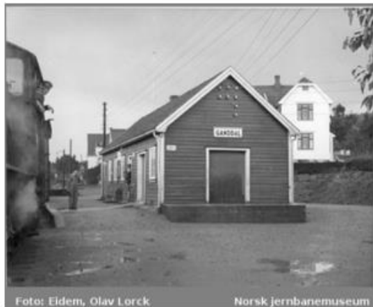
GANDDALEN NYE STASJONSBYGNING ETTER FLYTTINGEN I 1935.

Under 2. verdenskrig spilte Gandalen en viktig rolle i «Festung Stavanger». I området er det flere rester etter panservernringen til okkupasjonsmakten i form av steingarder og grøfter.