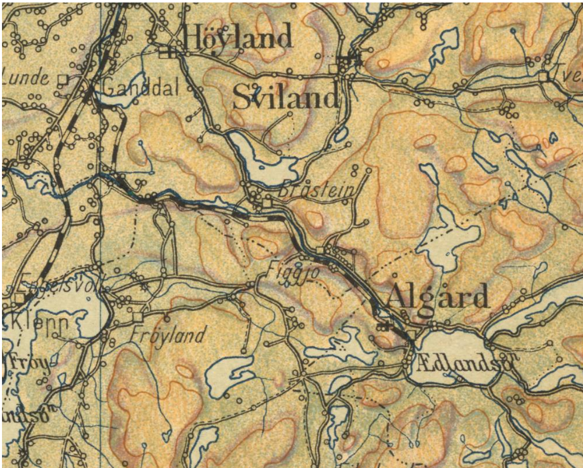
SKOLEKART FRA 1937 – STIPILET SVART LINJE VISER ÅLGÅDSBANEN

Persontrafikk nedlagt i 1955, godstrafikk 1988. Museumsaktiviteter i dag, men gjenåpning av vanlig drift er stadig et emne i offentlig ordskifte. Ålgårdbanen forsterket Ganddals rolle som knutepunkt.