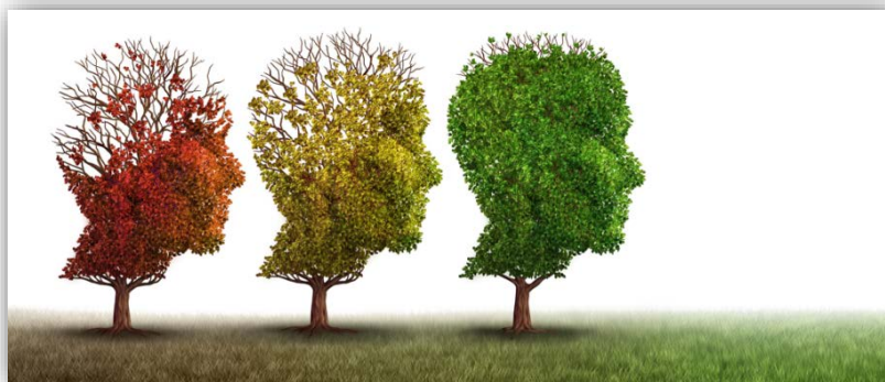
Illustrasjonsfoto fra forslag til Verdigrunnlag for rus- og psykisk helsearbeid i Rogaland og Sunnhodland. Ks- læringsnettverk 2017.