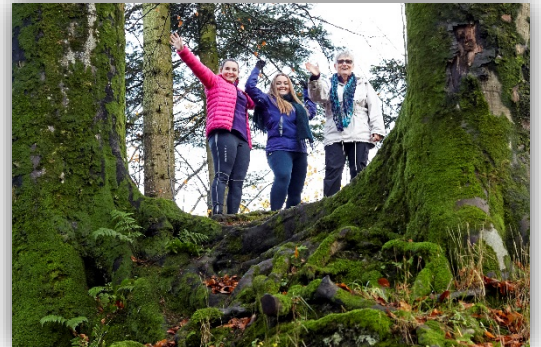
Brosjyren AKTIV2018 kan lastes ned her I dette notatet er bildene hentet fra AKTIV2018.

Flere deltok på en samling 6. desember 2017 med fokus på status og veien videre i mestringsenheten. Dette notatet oppsummerer fra dette møtet. Se også vedlegg sist i notatet, med innspill fra avdelingene i forkant. Det som ikke er så lett hverken å måle, eller oppsummere, men som er det viktigste, er det som skjer i de utallige møter mellom folk rundt omkring, når brukere, pårørende, ansatte, kollegaer og ledere møtes. Hvilke verdier former møtene? Innspillet fra Kristin fra NAPHA understreker dette (se pkt. 6)