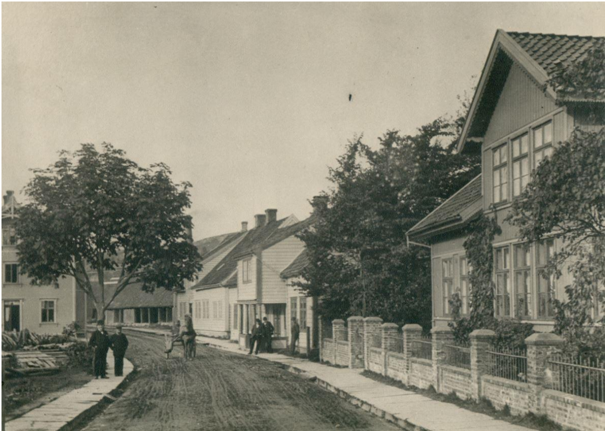
Nordre del av Langgata fotografert rundt 1900. Langgata 102 til høyre.

Kjeisargadå var betegnelsen på nordre del av Langgata fra den gamle Jernbaneplassen til Kaien på Neset. Dette var sentrum for mye av det offentlige livet i den unge byen.