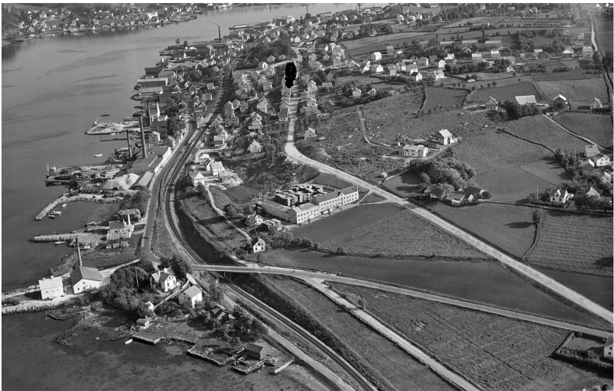
Widerøe 1954 (ika-w071042)