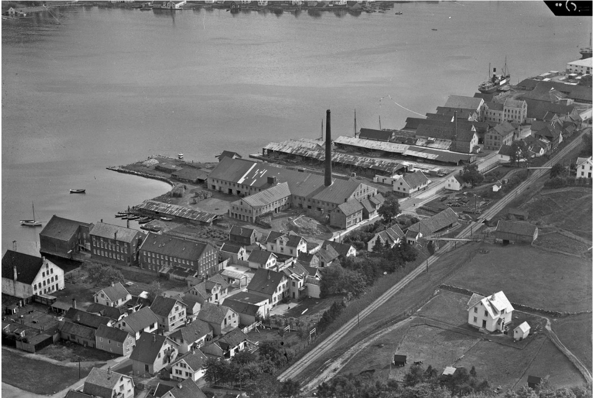
Widerøe 1935 (ika-w004352)