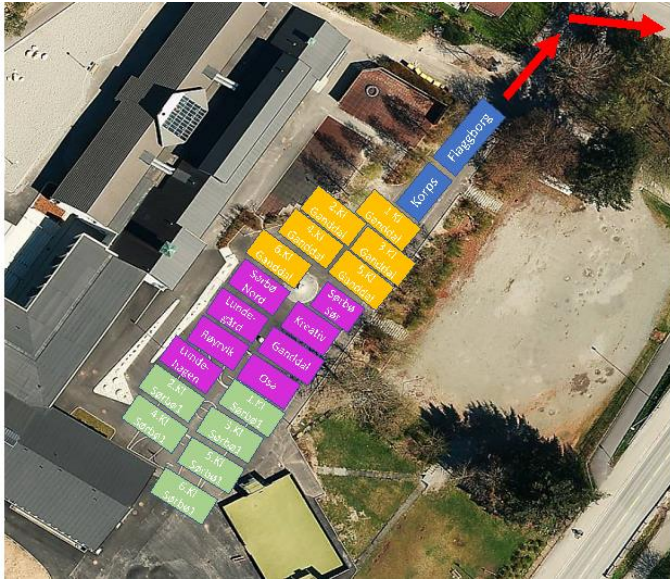
Togavgang ved Ganddal skole